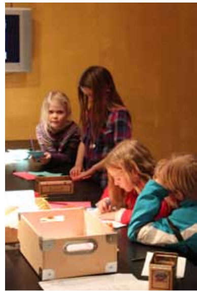
Smiðja fyrir fjölskyldur á Kjarvalsstöðum.