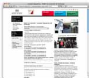
Pöntunarsíða fyrir fræðslu á heimasíðu safnsins.

Tekið er á móti skólahópum alla virka daga í söfnunum frá kl. 8:30–15:30 eða eftir samkomulagi. Heimsóknin tekur eina til tvær kennslustundir en semja má um lengri heimsókn sé þess óskað. Hámarksfjöldi nemenda í hópi er einn bekkur (um 25 nemendur).