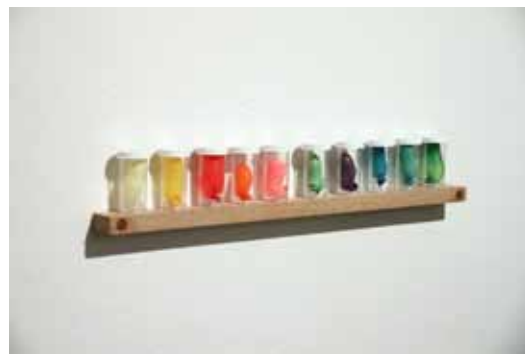
Hildigunnur Birgisdóttir, 2008. Tímasprengjur .