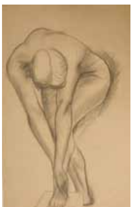
Ásmundur Sveinsson, skissa án titils og án ártals.