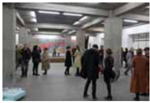
A-salur í Hafnarhúsi.