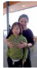
Mæðgin í safnheimsókn.