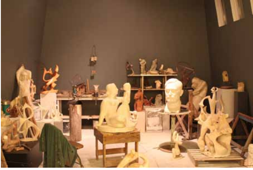
Endurgerð af vinnustofu Ásmundar í Ásmundarsafni.